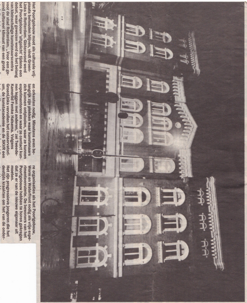
Het Portgebouw moet als culturele erfgoed behouden blijven, vindt GroenLinks in Rotterdam. Gestreefd wordt met Portgebouw 'uitgekiend' tijdens een van de historische kunstenaarscentra voor de stad Rotterdam. „Voor een goed cultureel klimaat van een grote