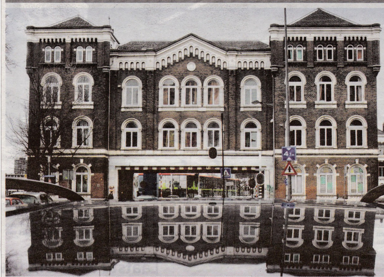
Het Poortgebouw op Zuid; symbool van de Rotterdamse kranerstraditie.